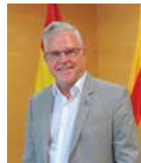
Pere Granados Carrillo Alcalde de Salou

Els convidem, doncs, a que participin i gaudeixin, al màxim, de tots els tallers, conferències i sortides que els hem preparat, amb el millor aprofitament i gaudiment.